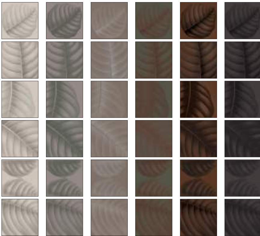
BO3030LC LYMPH CALCE 30x30 | 12"x12" BO3030LCE LYMPH CEMENTO 30x30 | 12"x12" BO3030LF LYMPH FANGO 30x30 | 12"x12" BO3030LE LYMPH ERBOLARIO 30x30 | 12"x12" BO3030LT LYMPH TERRACOTTA 30x30 | 12"x12" BO3030LL LYMPH LAVA 30x30 | 12"x12"