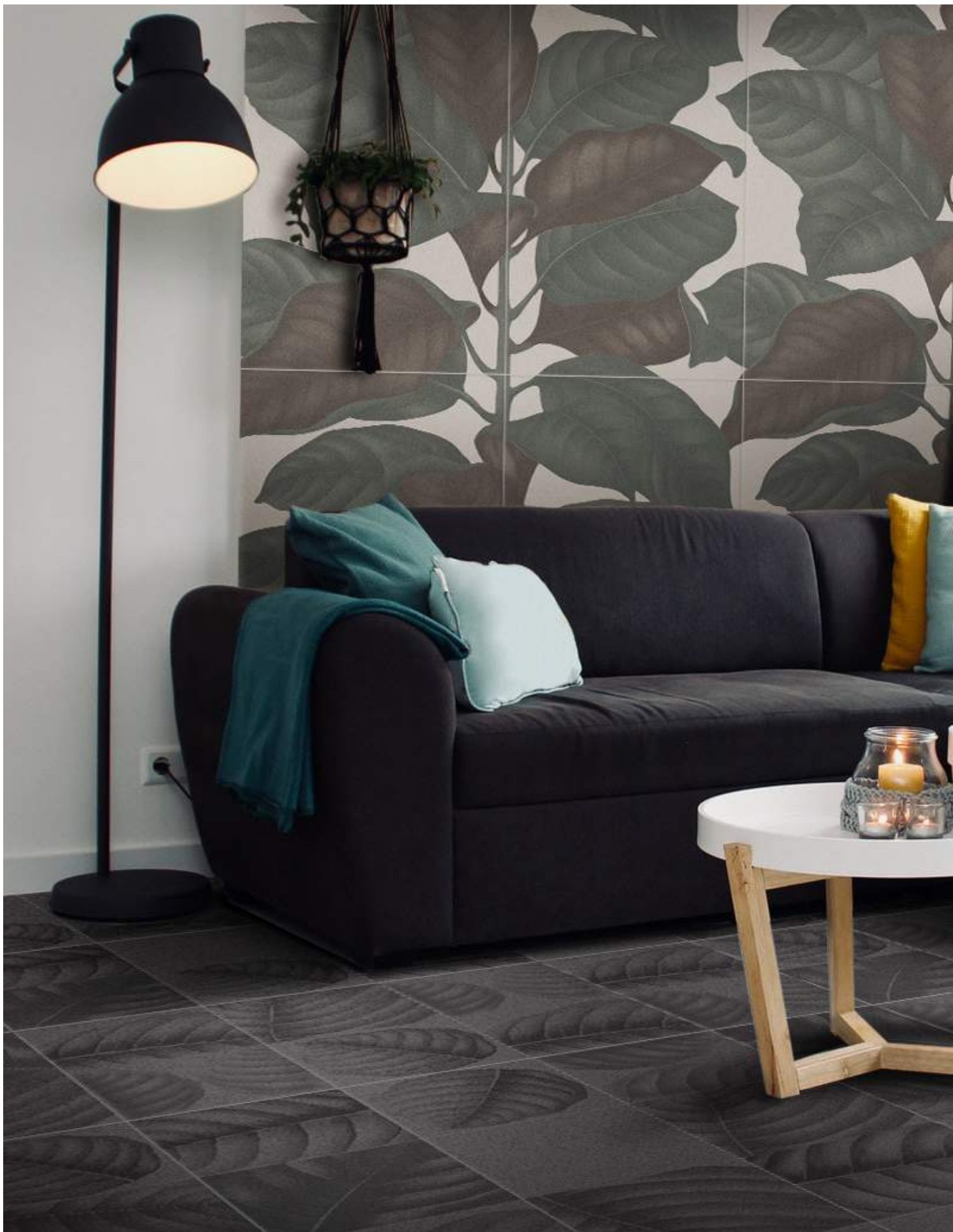
BO3030L LAVA | BO3030LL LYMPH LAVA | 30x30 | 12"x12" | BO60120LC LEAVES CALCE | 60x120 | 24"x48"