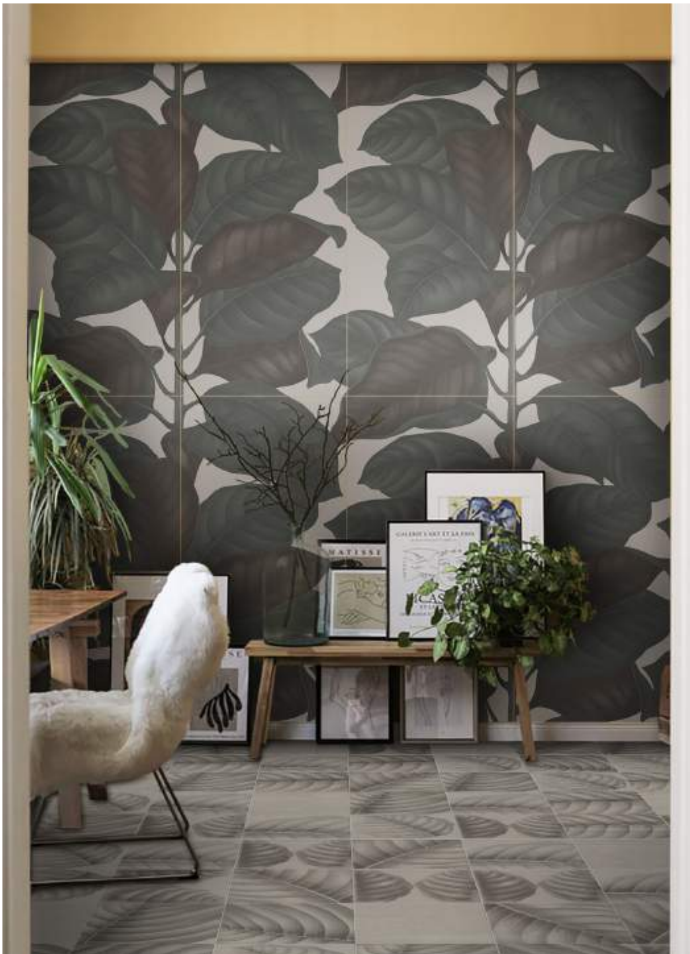
BO3030C CALCE | BO3030LC LYMPH CALCE | 30x30 | 12"x12" | BO60120LC LEAVES CALCE | 60x120 | 24"x48"