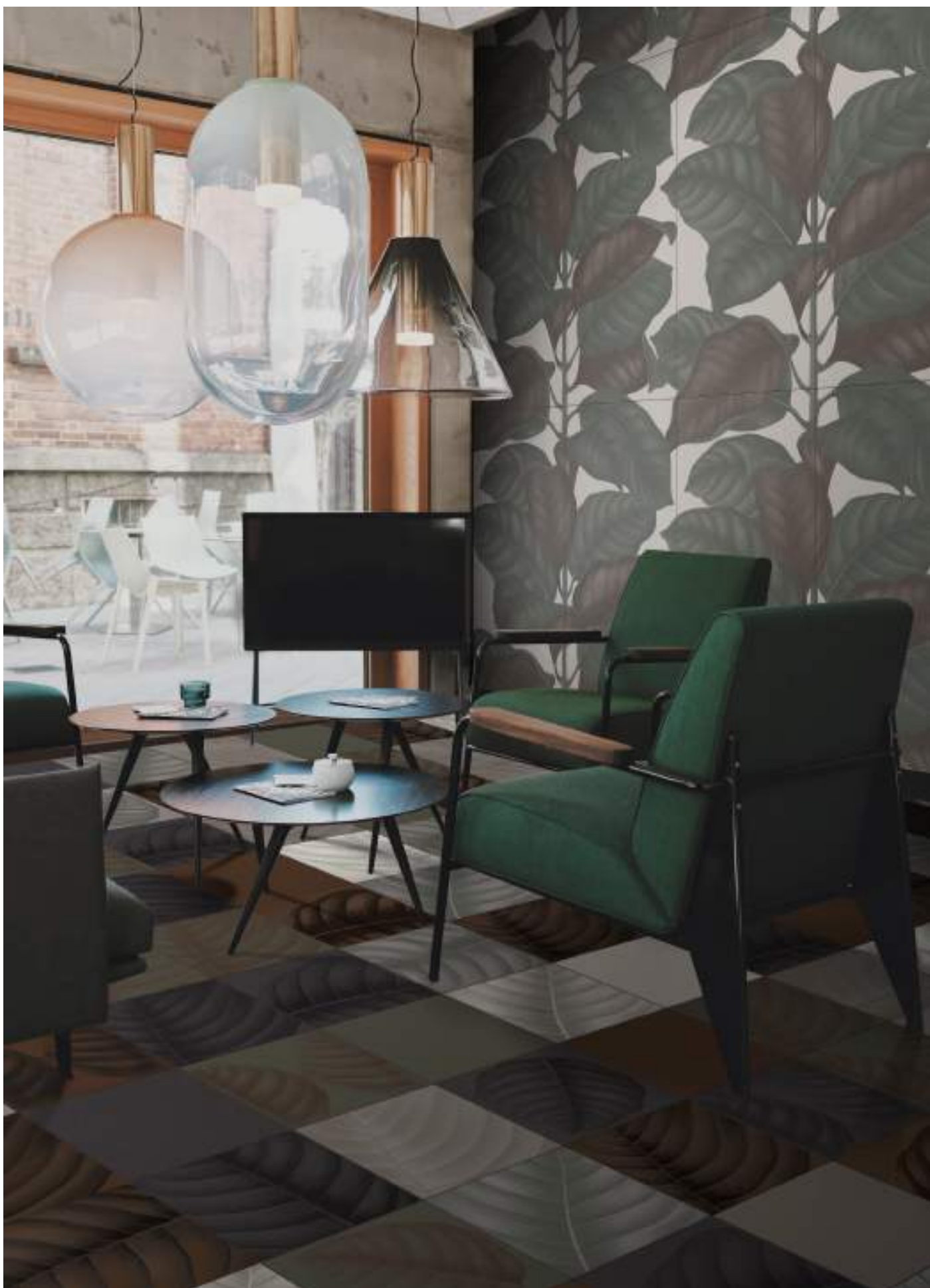
BO3030C CALCE | BO3030CE CEMENTO | BO3030F FANGO | BO3030E ERBOLARIO | B3030T TERRACOTTA | B3030L LAVA | BO3030LC LYMPH CALCE | BO3030LCE LYMPH CEMENTO | BO3030LF LYMPH FANGO | BO3030LE LYMPH ERBOLARIO | BO3030LT LYMPH TERRACOTTA | BO3030LL LYMPH LAVA 30x30 | 12"x12" | BO60120LEC LEAVES CALCE | 60x120 | 24"x48"