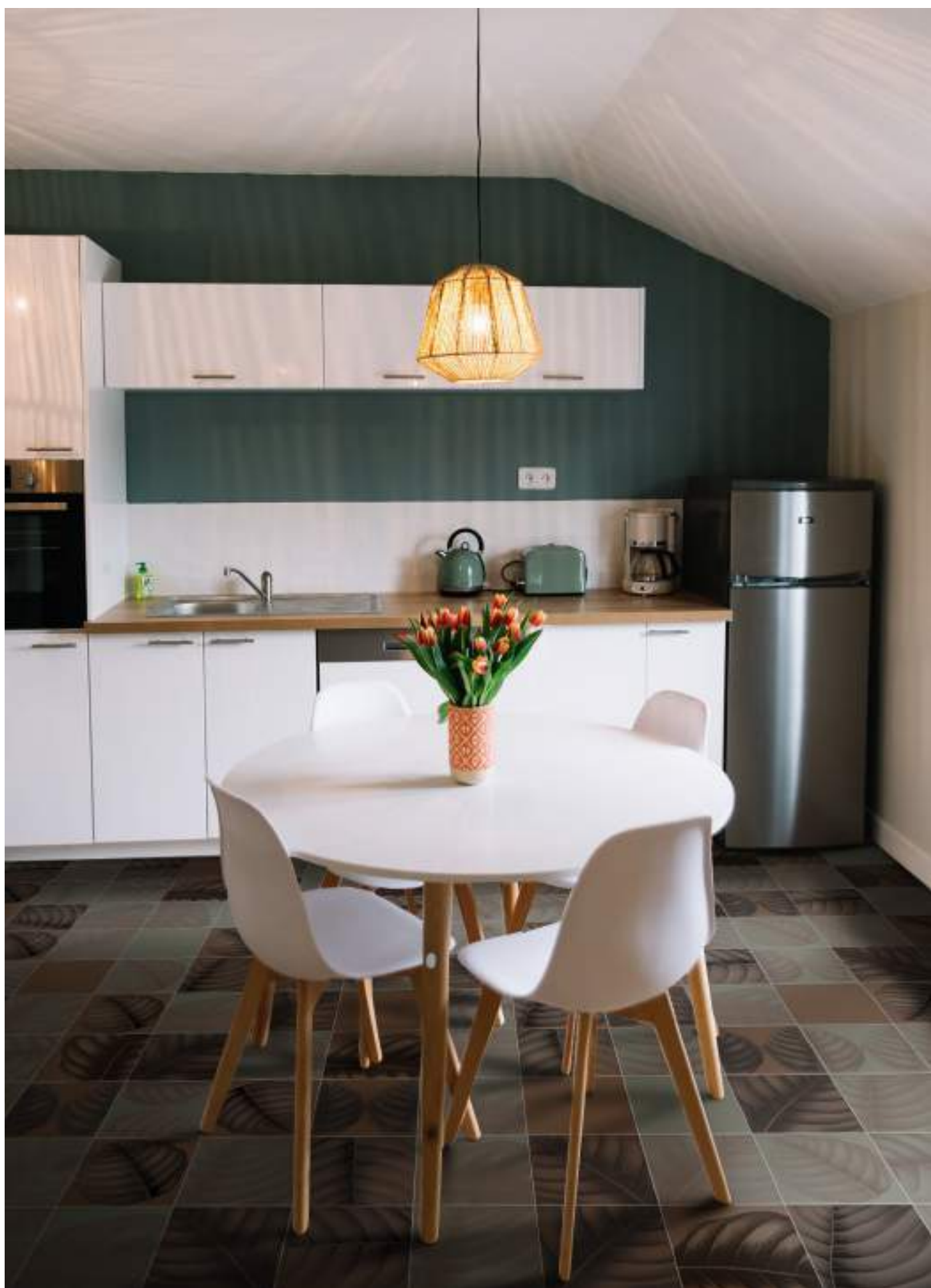
BO3030T TERRACOTTA | BO3030E ERBOLARIO | BO3030LT LYMPH TERRACOTTA | BO3030LE LYMPH ERBOLARIO | 30x30 | 12"x12"