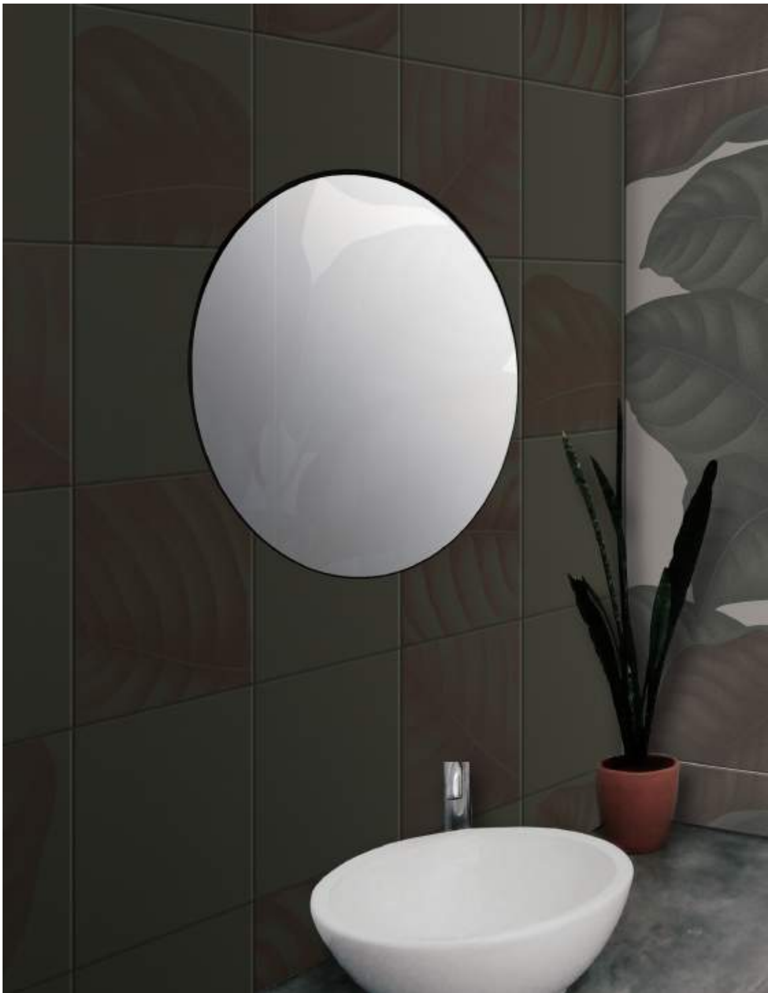
BO3030E ERBOLARIO 30x30 | 12"x12" | BO60120LC LEAVES CALCE | 60x120 | 24"x48"