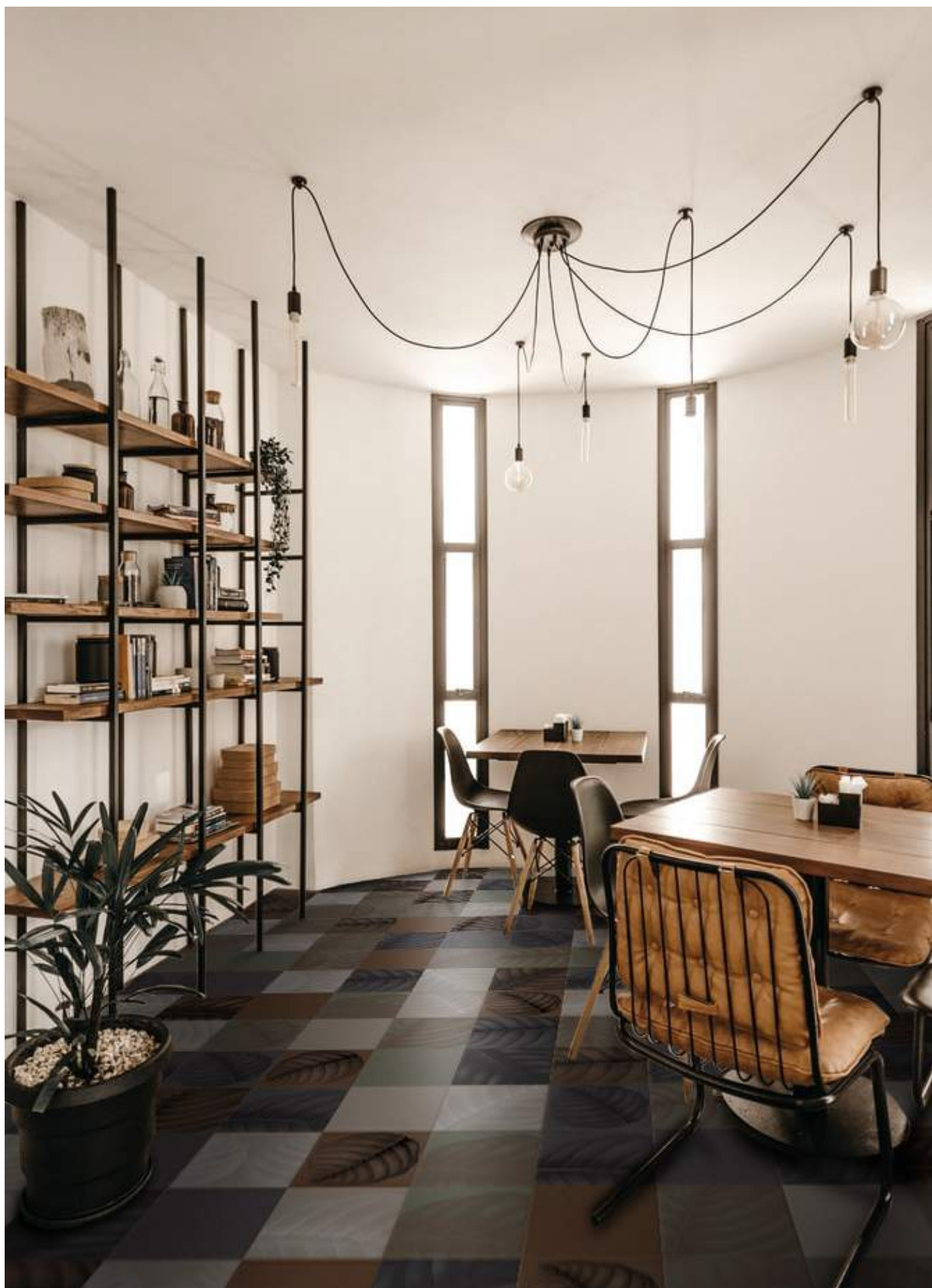
BO3030L LAVA | BO3030T TERRACOTTA | BO3030F FANGO | BO3030E ERBOLARIO | BO3030LL LYMPH LAVA | BO3030LT LYMPH TERRACOTTA BO3030LF LYMPH FANGO | BO3030LE LYMPH ERBOLARIO | 30x30 | 12°x12°