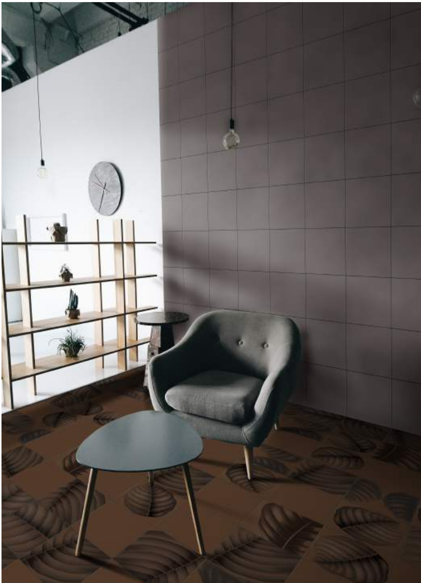
BO3030T TERRACOTTA | BO3030CE CEMENTO | BO3030LT LYMPH TERRACOTTA | 30x30 | 12"x12"