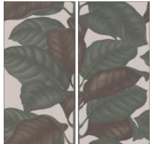
BO60120LEC LEAVES CALCE 60x120 | 24"x48"