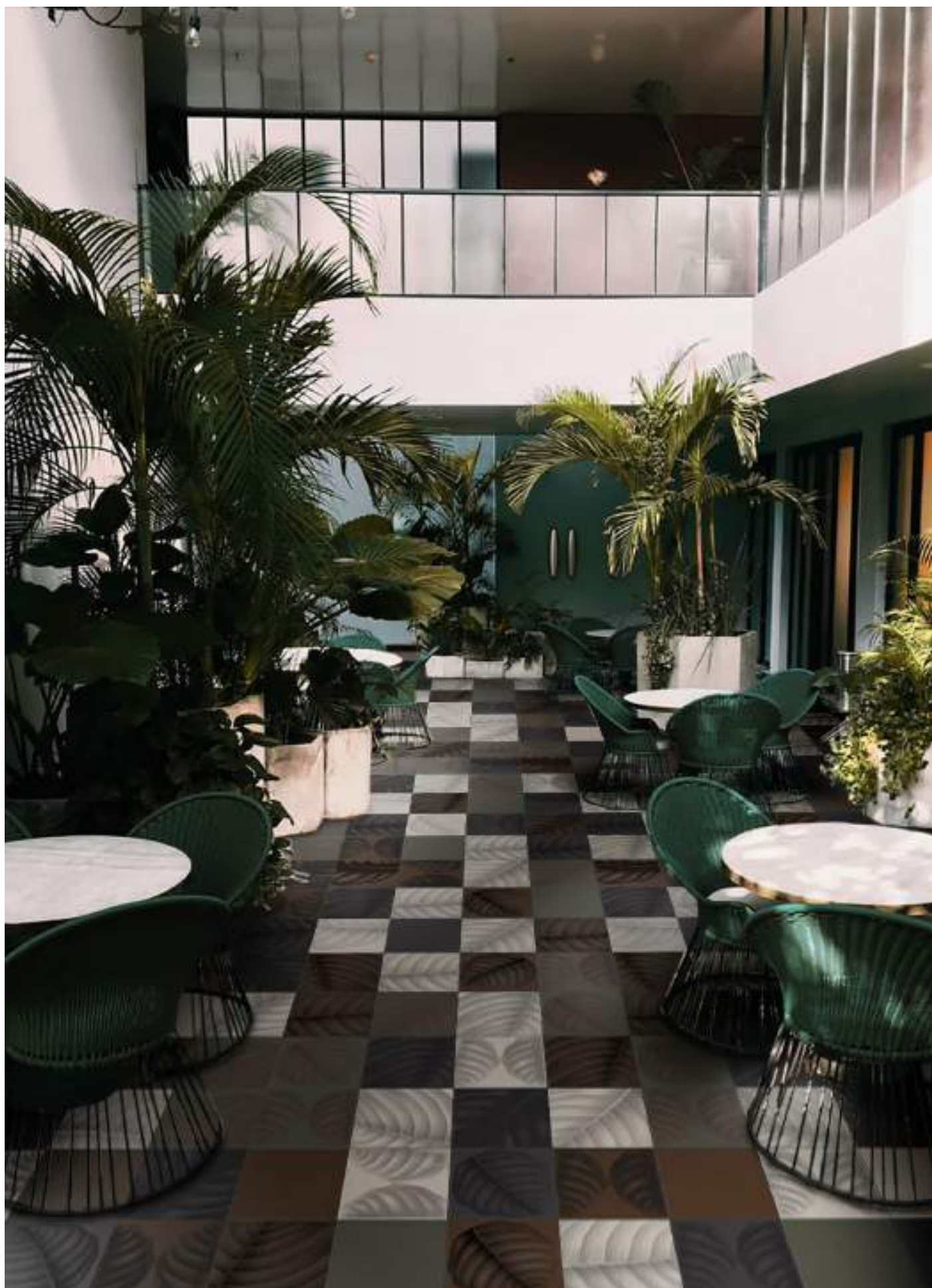
BO3030C CALCE | BO3030L LAVA | BO3030T TERRACOTTA | BO3030E ERBOLARIO | BO3030LC LYMPH CALCE | BO3030LL LYMPH LAVA BO3030LT LYMPH TERRACOTTA | BO3030LE LYMPH ERBOLARIO | 30x30 | 12"x12"